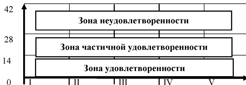
Рис. 2. Профиль потребностей

Подсчитайте суммы баллов по каждой из 5-ти секций и отложите на вертикальной оси графика результата. По точкам-баллам постройте общий график результата, который укажет три зоны удовлетворенности по пяти потребностям