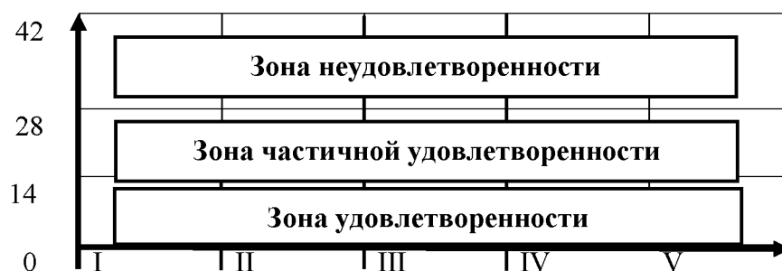
Рис. 2. Профиль потребностей

Сделайте вывод: какие потребности находятся в зоне неудовлетворенности, они и будут являться актуальными или доминирующими, а потребности, находящиеся в зоне удовлетворенности, не являются вашими мотивами поведения.