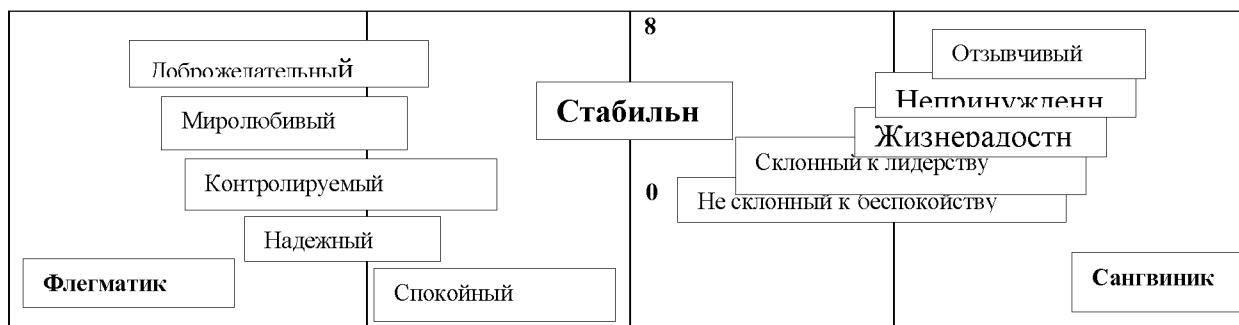
Рис. 1. Квадрат Айзенка для графического определения типа темперамента